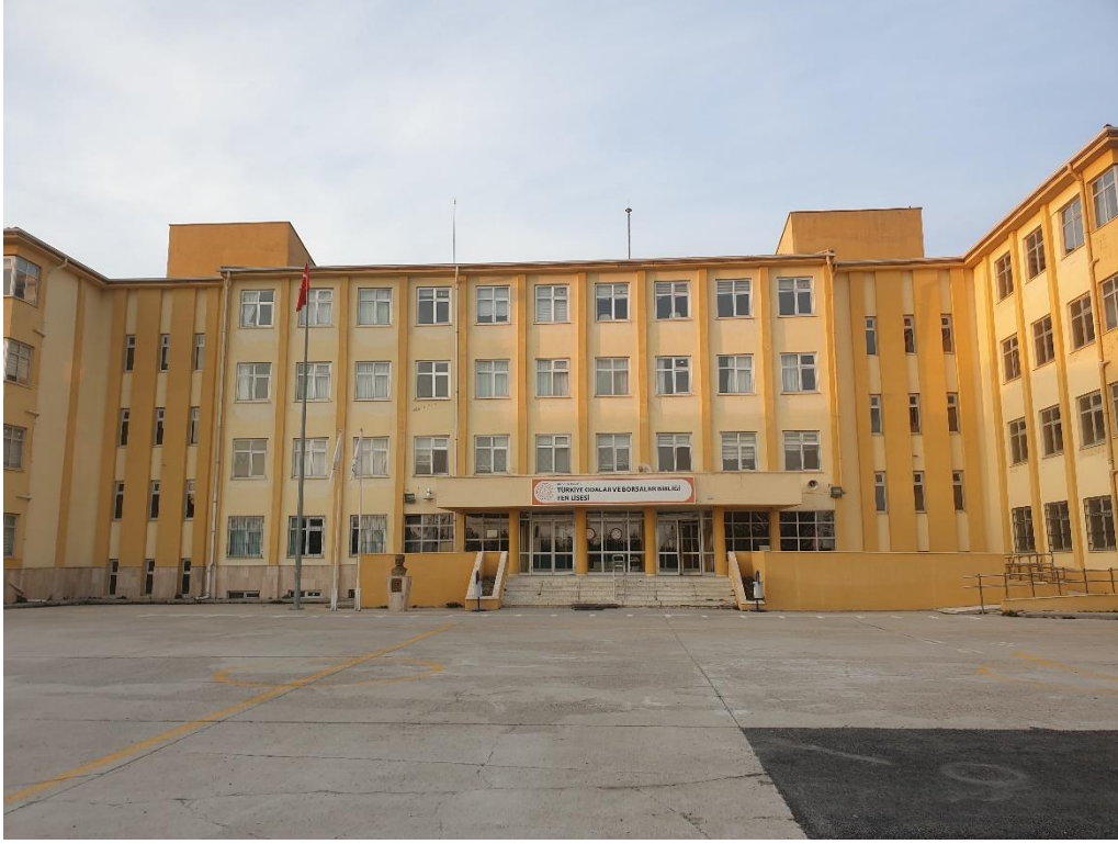
Şekil 3. Polatlı TOBB Fen Lisesi Dış Görünüş-1