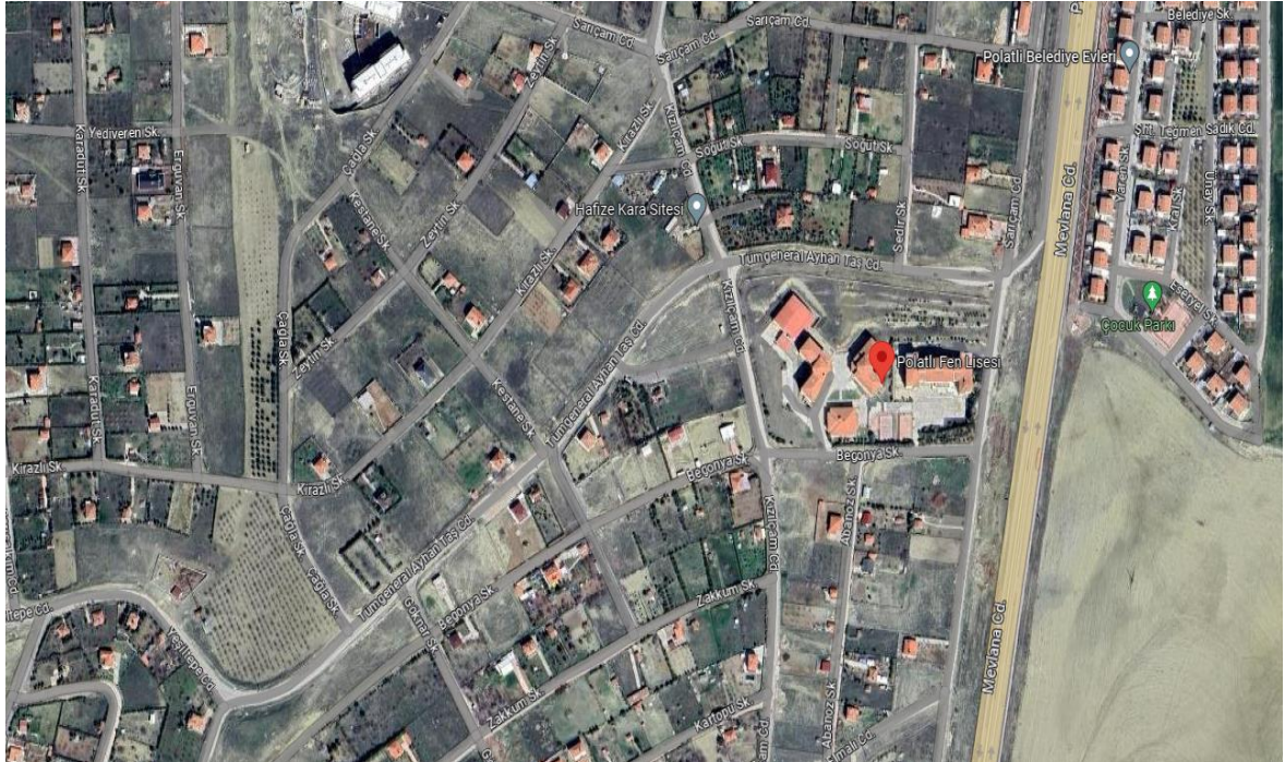
Şekil 2. Polatlı TOBB Fen Lisesi Konumu