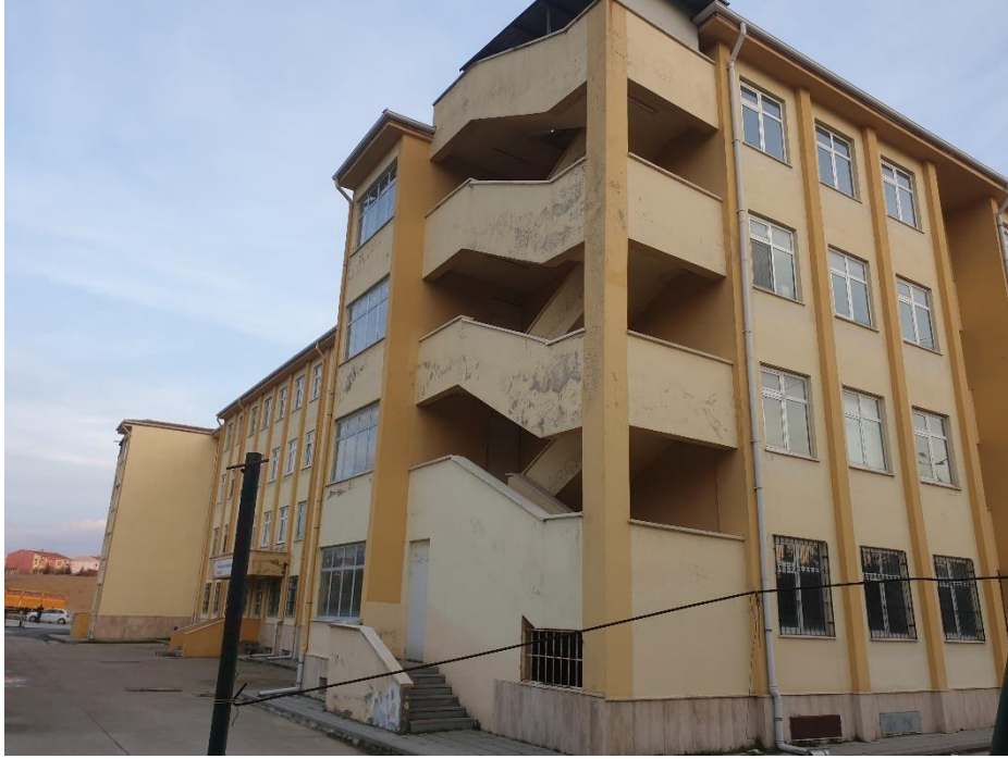
Şekil 4. Polatlı TOBB Fen Lisesi Dış Görünüş-2