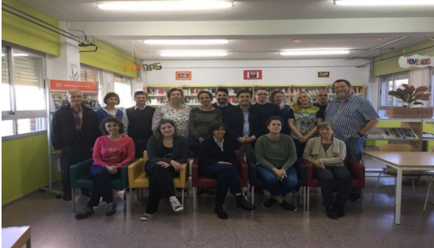
İspanya'daki Koordinasyon Toplantısı

Proje kapsamında 2016 yılında İtalya'da, 2017 yılında İngiltere'de ve 2018 yılında İspanya'da olmak üzere 3 koordinasyon toplantısı yapıldı.